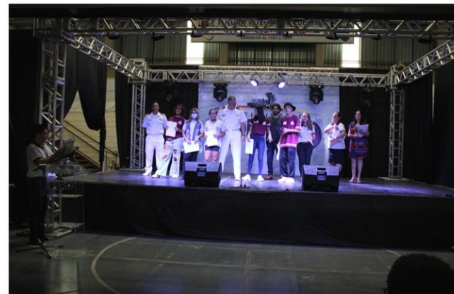
Entrega de Certificados de Participação aos alunos da E. M. Dona Elisa Moreira dos Santos