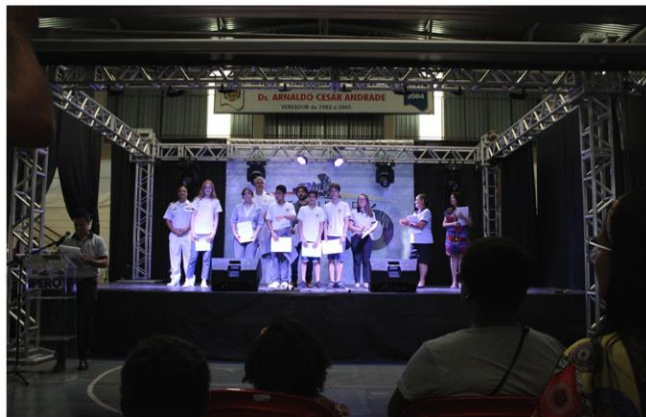
Entrega de Certificados de Participação aos alunos da E. M. Prof a Henory de Campos Góes