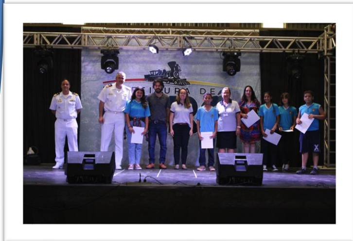
Entrega de Certificados de Participação aos alunos da E. M. Profª Zilma Thibes Mello