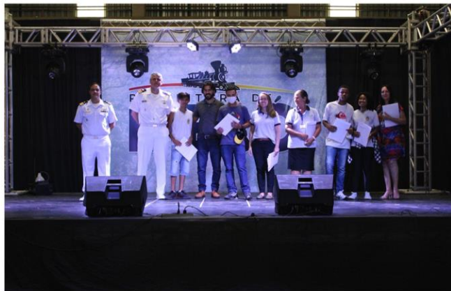
Entrega de Certificados de Participação aos alunos da E. M. Prof ª Pedrina de Campos Pedrozo Rosa