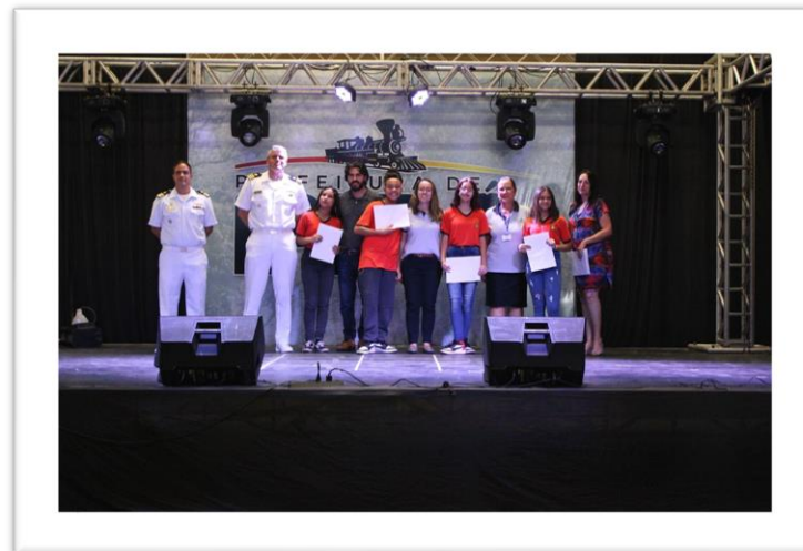
Entrega de Certificados de Participação aos alunos da E. M. Francisco Adolfo de Varnhagen